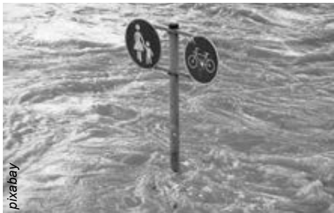
Stehen uns durch den Klimawandel in Zukunft mehr Starkregen und Hochwasserereignisse bevor?